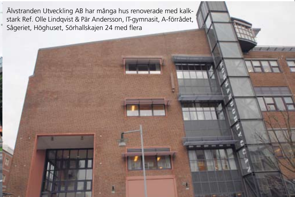
Älvstranden Utveckling AB har många hus renoverade med kalkstark Ref. Olle Lindqvist & Pär Andersson, IT-gymnasiet, A-förrådet, Sågeriet, Höghuset, Sörhalls kajen 24 med flera

Främsta orsakerna till detta är brist på kunskap och otillräckliga erfarenheter om använda material. Felaktiga metoder och brister i utförandet ökar skadefrekvensen ytterligare.