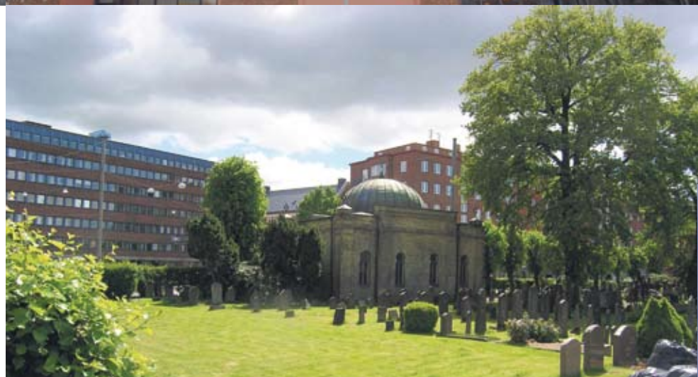
Mosaiska begravningskapellet, Göteborg

Renoverat under tillsyn av Länsstyrelsen. Från att från början ha legat utanför Göteborgs stadsgräns, ligger det judiska begravningskapellet idag omringat och utsatt för både järnväg och tung trafik. Kapellet har framgångsrikt behandlats med Kalkstark.