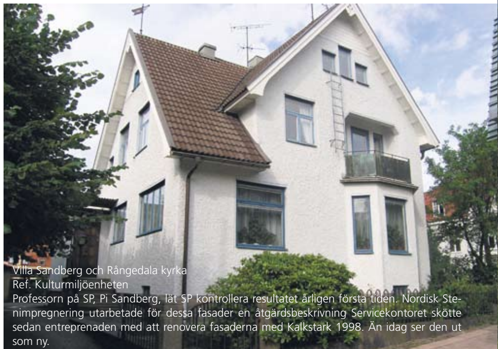
Villa Sandberg och Rångedala kyrka Ref. Kulturmiljöenheten

Renoverat under tillsyn av Länsstyrelsen. Från att från början ha legat utanför Göteborgs stadsgräns, ligger det judiska begravningskapellet idag omringat och utsatt för både järnväg och tung trafik. Kapellet har framgångsrikt behandlats med Kalkstark.